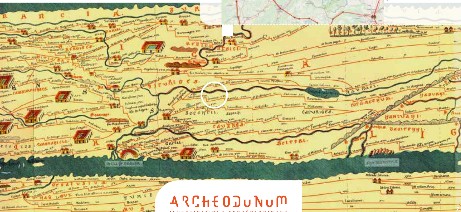
Fig. 7 : Table de Peutinger. Le nom de Lemincum apparaît dans le cercle blanc. Fond www.leg8.fr - Fig. 8 : L'itinéraire antique Vienne-Aoste reporté sur une carte actuelle. D'après www.omnesviae.org