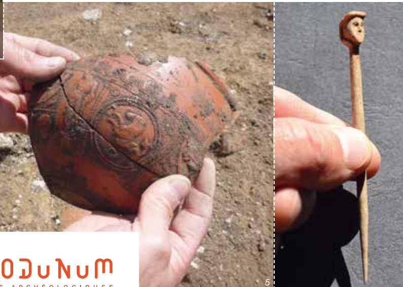
Fig. 2 : La rue principale et ses abords. - Fig. 3 : Plan des principaux vestiges. - Fig. 4 : Dessin d'une base de colonne. - Fig. 5 : Poterie gallo-romaine ornée d'un monstre marin. - Fig. 6 : Epingle à cheveux en os.