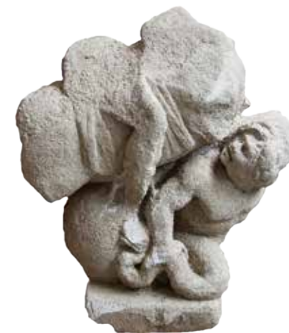
Riom. Cavalier à l'anguipède.

L'accès aux données et aux résultats d'une très grande partie des fouilles archéologiques préventives est resté très longtemps confidentiel. Il fallait donc impérativement remédier à cette situation. C'est tout l'enjeu de cet ouvrage. La société Archeodunum a décidé de contribuer, à sa manière, sous la forme d'une publication scientifique, à l'enrichissement de nos connaissances du monde rural gallo-romain en publiant une série d'études concernant les fouilles qu'elle a menées au cours de ces dix dernières années.