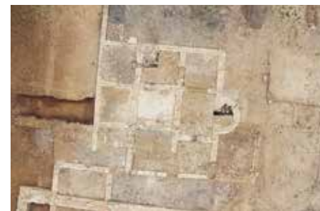
Anse-Pommiers. Thermes septentrionaux.

Le monde rural et les campagnes de la Gaule romaine ont longtemps été les parents pauvres de l'histoire antique. Tout au moins ont-ils été abordés, le plus souvent, au travers du prisme des vestiges les plus imposants et de ceux qui illustraient le mieux l'économie domaniale décrite par les textes (agronomes et arpenteurs notamment, sources épigraphiques). À partir des années 1980, cette conception monolithique a été profondément renouvelée grâce à l'émergence d'équipes et de programmes de recherches spécifiques, à la multiplication des colloques et des publications, des séminaires et des travaux universitaires. Au travers de thématiques qui se sont diversifiées, on dresse aujourd'hui un tableau plus nuancé et plus riche de l'occupation et de l'exploitation des campagnes de Gaule à l'époque romaine. Cette dynamique est indissociable du développement de l'archéologie préventive qui, dans le même temps, a alimenté et diversifié les catalogues de sites, et a nourri la réflexion sur les campagnes, leur rapport au monde urbain et leur place dans le développement du territoire.