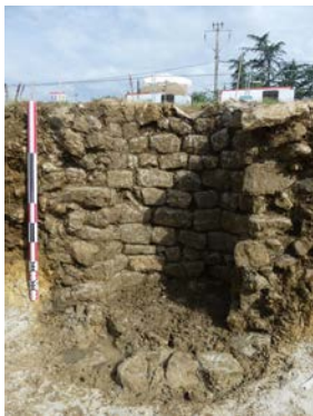
Vue en coupe du puits

Cette fouille archéologique a été prescrite par le Service Régional de l'Archéologie (DRAC Occitanie) suite aux résultats positifs de diagnostics archéologiques du chantier de l'A 69. Un puits antique est la seule structure découverte sur l'emprise prescrite. Le mobilier archéologique ramassé dans le comblement du puits est varié : fragments de tegulae, de céramique, d'objets métalliques, du verre ainsi que des éléments organiques. Les premiers résultats des études du mobilier datent l'abandon du puits au milieu du I er siècle de notre ère. L'analyse des autres éléments du mobilier permettra de compléter ces premières observations.