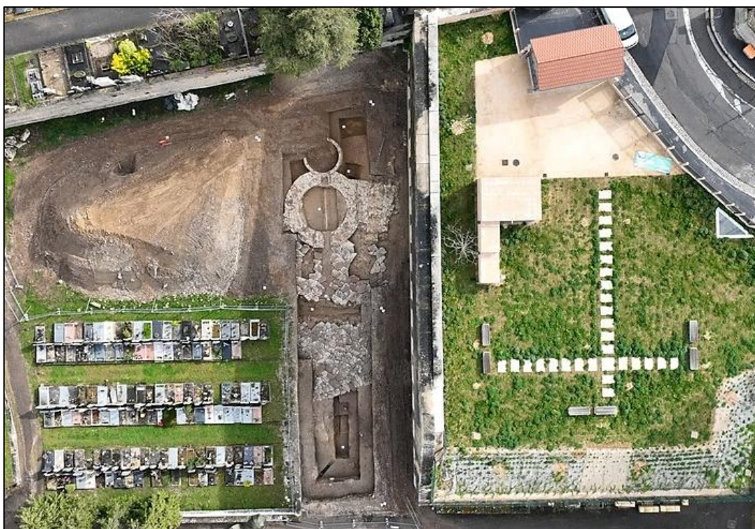
Fouille de la voie et de l'enceinte du Haut-Empire, cimetière de Loyasse, Lyon 5 e , RO C. Ducourthial (DAVL), ©Lyon Drone Service

Organisées par la DRAC Auvergne-Rhône-Alpes Service Régional de l'Archéologie