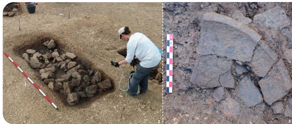
1. Plan général des vestiges. - 2. Foyer à pierres chauffées en cours de fouille. - 3. Détail d'un fragment de céramique découvert dans le comblement d'un foyer.