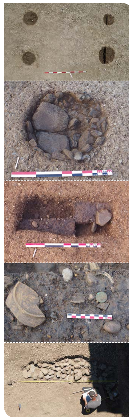
4. Bâtiment sur poteaux. - 5. Silo. - 6. Bûcher en cours de fouille - 7. Fragment de céramique et monnaie découverts lors de la fouille du bûcher. - 8. Dessin d'un mur moderne par un archéologue.

Au terme de la fouille, en juillet 2025, le patrimoine archéologique aura été sauvegardé et le projet immobilier se poursuivra. Concernant l'archéologie, différentes études seront conduites en laboratoire pendant deux ans. Les conclusions seront rassemblées dans un rapport remis à l'État avec l'ensemble de la documentation et des artefacts collectés sur le site.