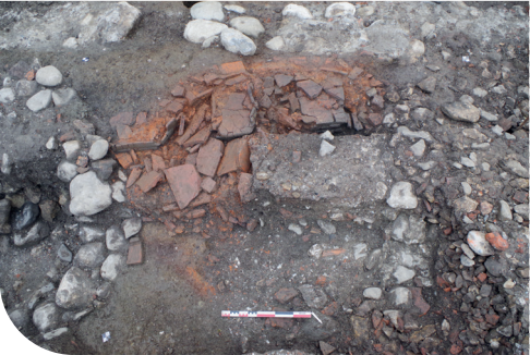
4. Le four de potier.

Au sud de la rue, un autre bâtiment peut être interprété comme un atelier de potier, voisinant avec une forge. Cet atelier, environné de nombreux puits, abrite un four destiné à cuire la céramique (fig. 4). Autre élément remarquable, un grand dépotoir contient les nombreux restes de céramiques évacués de l'atelier, dont certaines pièces se sont avérées complètes (fig. 5). Le dépotoir a également servi au forgeron voisin, qui a jeté ici de nombreuses scories et blocs-tuyères en terre cuite, destinés à alimenter en air des bas fourneaux.