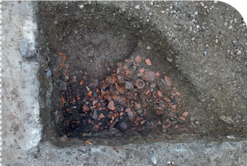
5. Le dépotoir et son contenu de fragments de céramiques.