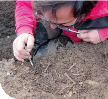
3. Sépulture d'enfant en cours de fouille.

Depuis le 6 octobre 2025, une équipe d'Archeodunum fouille une parcelle de 600 m 2 au cœur d'Annecy, en préalable à la construction d'un bâtiment d'habitation portée par la société EDIFIM. À l'époque romaine, période concernée par la fouille, cette zone est située à environ 200 m au nord de la place centrale de l'agglomération de Boutidurum/Boutae. De part et d'autre d'une rue, c'est un quartier résidentiel et artisanal qui est exploré par les archéologues, avec ses habitations, un atelier de potier, plusieurs puits et quelques tombes d'enfants.