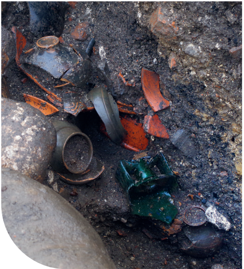
6. Quelques objets en céramique et en verre dans un puits.

À l'ouest de ce bâtiment, les archéologues ont entrepris la fouille d'un puits, sans doute lié au nouveau bâtiment (cf. fig. 1). Les cinquante premiers centimètres de son comblement ont livré un lot conséquent de vaisselle en céramique métallescente et sigillée, ainsi que des objets en verre et en bronze (fig. 6).