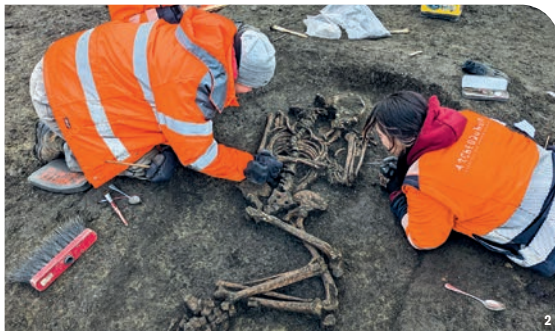
1. Plan des vestiges. - 2. Sépulture à inhumation.

Les vestiges les plus anciens sont trois sépultures à inhumation (fig. 2), qui dateraient de la fin du Néolithique ou du début de l'âge du Bronze (début du II e millénaire avant notre ère). Cette attribution chronologique repose sur la disposition particulière des défunts, inhumés en position fœtale, ainsi que sur des comparaisons avec des découvertes locales du même type. Des datations radiocarbone permettront de le vérifier.