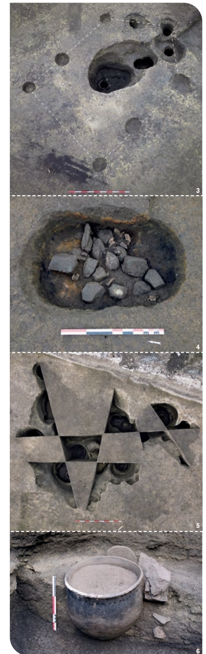
3. Plan d'un bâtiment sur poteaux porteurs édifié au-dessus d'une cave abritant un puits et un silo. - 4. Foyer à pierres chauffées. - 5. Grande fosse "polylobée" en cours de fouille. - 6. Vase au fond d'un puits.

À l'issue de la fouille, en mai 2025, le patrimoine archéologique aura été sauvegardé, et le réaménagement du quartier se poursuivra. Côté archéologie, les investigations se poursuivront en laboratoire durant deux ans. Les résultats seront rassemblés dans un copieux rapport, remis à l'État avec l'ensemble de la documentation et des objets collectés sur le site.