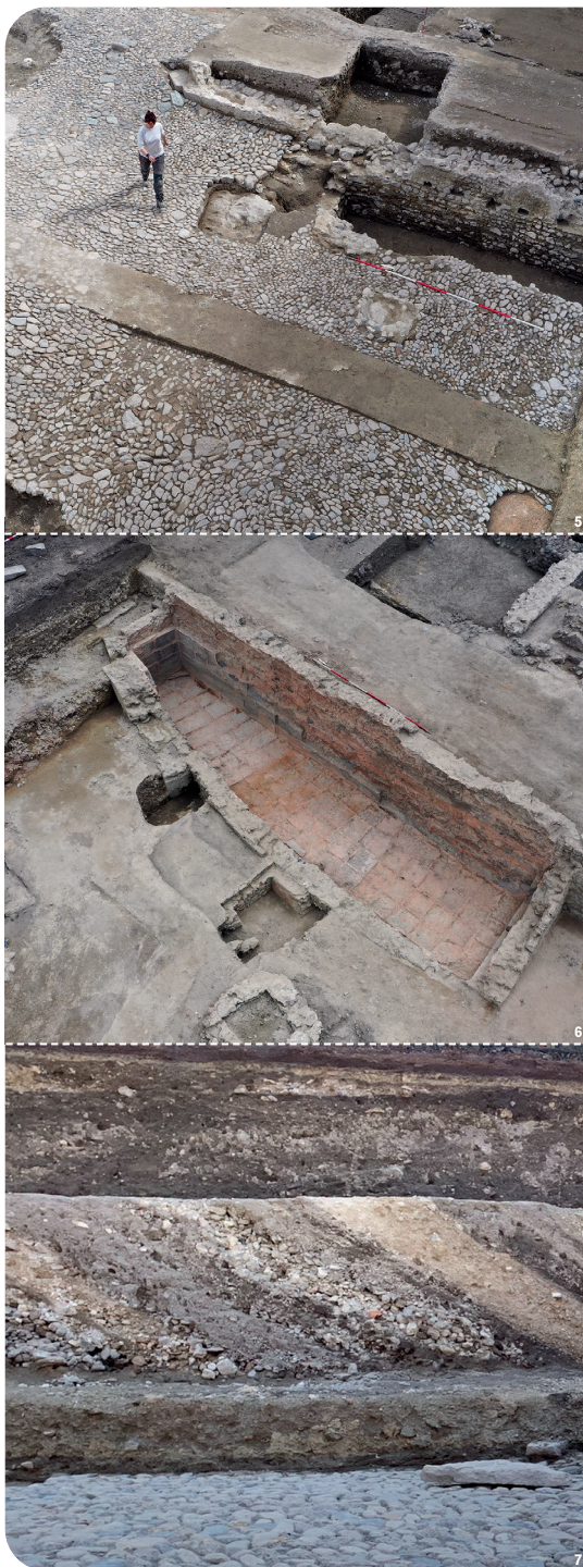
Fig. 7 : La construction de l'Hôtel-Dieu (1770) a nécessité de puissants remblais, visibles sous la forme de couches obliques au pied des murs.