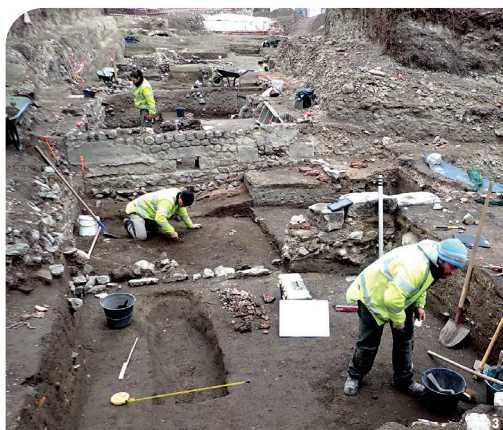
Fig. 2 : Plan des vestiges par grande phase (époque romaine, Moyen Âge, époque moderne) - Fig. 3 : Sous le futur « jardin de lecture », fouille d'un quartier romain. - Fig. 4 : Applique en céramique représentant un personnage barbu (5 cm).