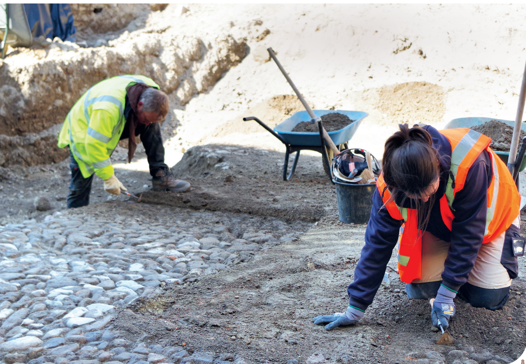
Fig.8 : Fouille minutieuse d'un pavement.

Une quinzaine de spécialistes de différentes disciplines vont mener des études pour affiner les données du terrain. Tous les résultats seront synthétisés dans un rapport qui sera ensuite remis à l'État.