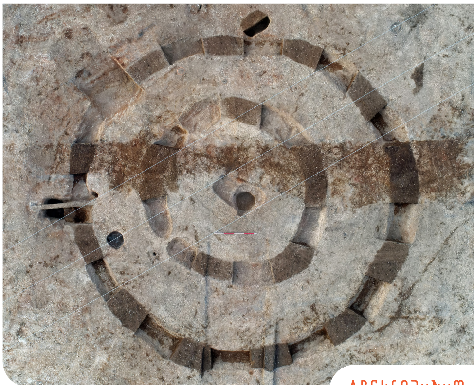
Fig.1 : Vue verticale du monument circulaire de l'âge du Bronze (© Ukko Cartographie).