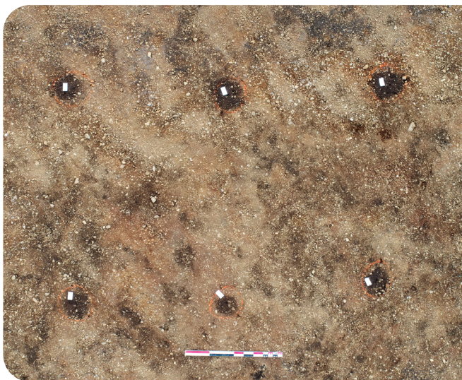
Fig. 2 : Les six poteaux du bâtiment attribué au Néolithique (© Ukko Cartographie).

La première occupation du site, très discrète, a pu être datée du Néolithique moyen II, vers le 4 e millénaire av. J.-C., grâce à des analyses au radiocarbone ( 14 C). La fouille a mis au jour un potentiel foyer et une petite construction rectangulaire sur poteaux, d'une superficie d'environ 7 m 2 (fig. 2 et 3). Rare pour l'époque, cette structure à nef unique intrigue par sa taille modeste et invite à la prudence quant à sa datation précise.