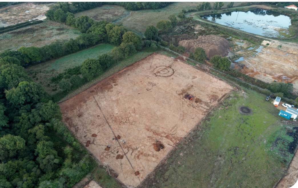
Fig.8 : Vue générale de la fouille (© Ukko Cartographie).

Une fois validé, il est mis à disposition sur la plateforme scientifique HAL. Au total, ces investigations auront permis d'éclairer une partie des zones d'ombre sur les fonctions de l'enclos et des structures associées, tout en enrichissant notre compréhension des sociétés de l'âge du Bronze ancien.