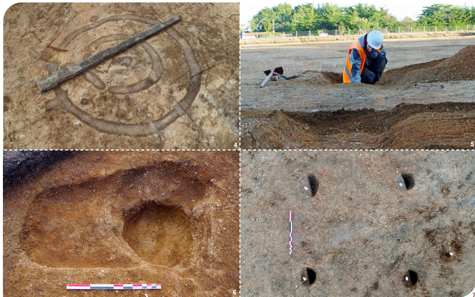
Fig. 4 : Le monument de l'âge du Bronze. Diamètre extérieur 17 m (© Ukko Cartographie). - Fig. 5 : Exploration d'un fossé. - Fig. 6 : La fosse centrale du monument circulaire. - Fig. 7 : Un bâtiment sur quatre poteaux (© Ukko Cartographie).

menté dans le centre-ouest de la France. L'enceinte externe, d'un diamètre de 17 m, est continue. Quant à l'enclos interne, d'un diamètre de 9,50 m, il présente un fossé en forme de fer à cheval, complété à l'est par deux fosses oblongues (fig. 1 et 3-5).