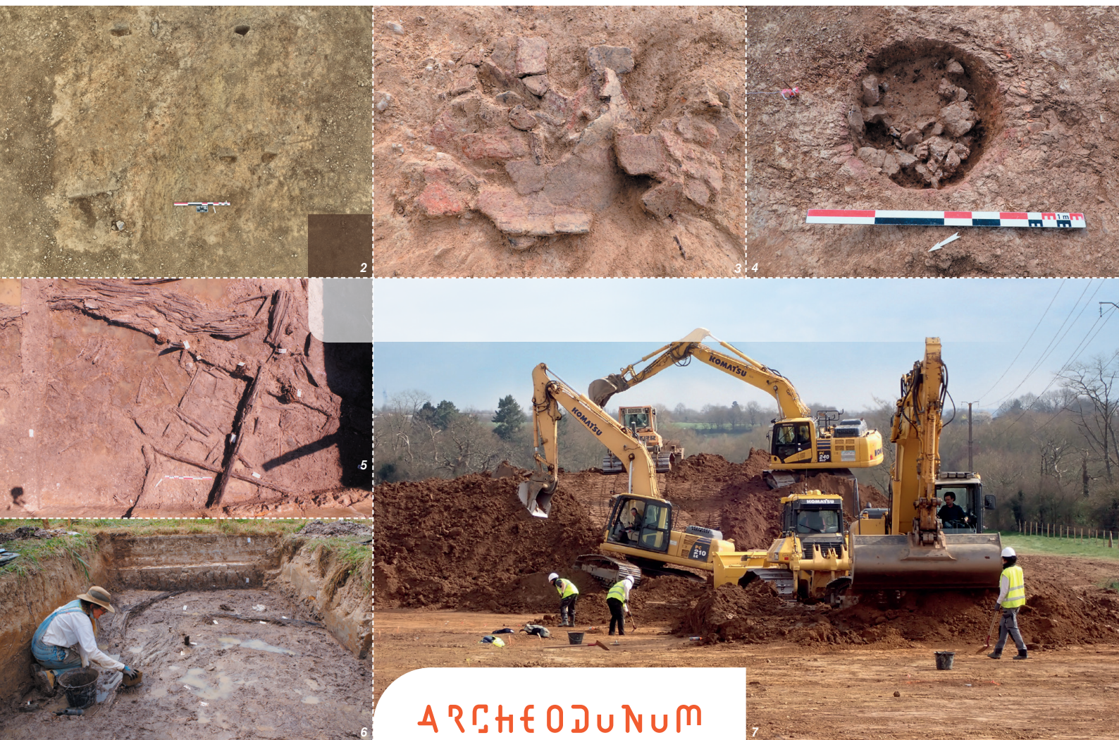
Fig. 7 : Décapage du site archéologique.