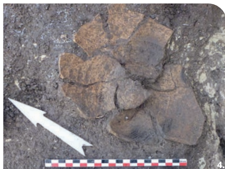
3 - 4. Poteries médiévales.