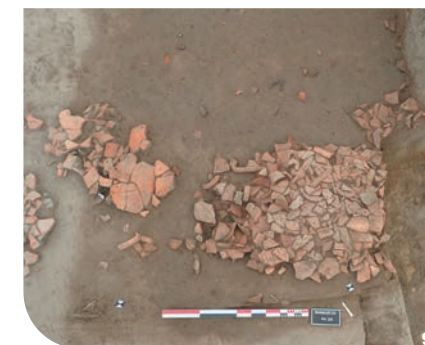
2 : Les archéologues au travail - 3 : Plan général du site archéologique - 4 : Monnaie gauloise (taille réelle) 5 : Fragment d'anneau en verre (taille réelle) 6 : Fragment de poterie - 7 : Fragment d'amphore avec la marque du fabricant EV - 8 : Puits rempli de fragments d'amphores 9 : Sol en fragments d'amphore