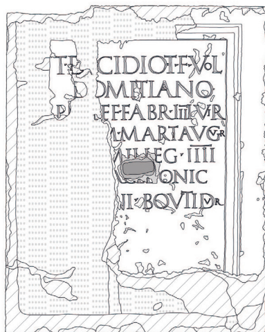
Fig. 8 : Bloc avec une inscription mentionnant Titus Decidius Domitianus.