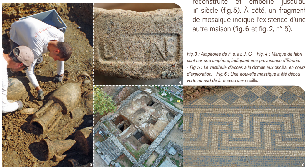
Fig. 3 : Amphores du I er s. av. J.-C. - Fig. 4 : Marque de fabricant sur une amphore, indiquant une provenance d'Etrurie. - Fig. 5 : Le vestibule d'accès à la domus aux oscilla , en cours d'exploration. - Fig. 6 : Une nouvelle mosaïque a été découverte au sud de la domus aux oscilla .