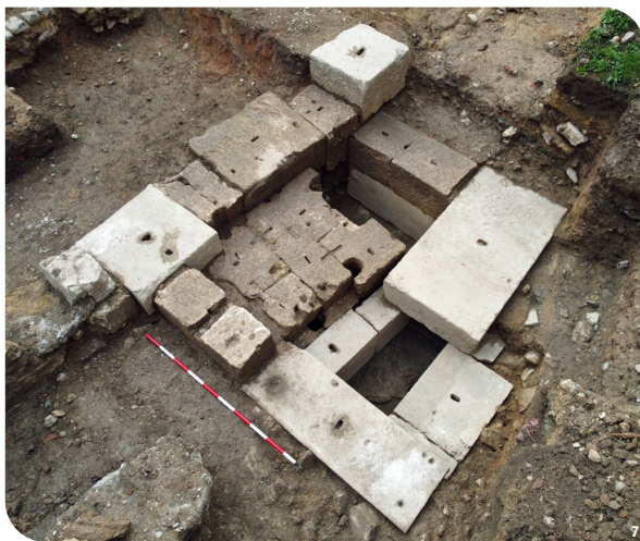
Fig. 7 : Les fondations de la fontaine en grands blocs de taille.

Devant la domus , un portique monumental longeait l'ancienne rue. Composé de bases calcaires supportant des colonnes, il servait d'appui à une fontaine aujourd'hui disparue (fig. 7 et fig. 2, n° 6). Seuls subsistent une conduite en plomb et un égout d'évacuation, ainsi que la fondation soutenant cette fontaine. Fait remarquable, ce massif était formé de blocs de remploi, certains ornés d'inscriptions gravées : des fragments de piédestaux ayant autrefois porté des statues honorifiques.