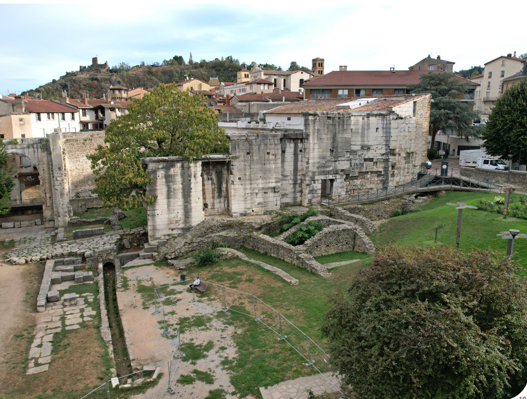
10 Fig. 10 : Le jardin de Cybèle avec la curie et l'entrée du forum.

de mieux comprendre les dynamiques urbaines, artisanales et politiques de la cité entre le II e siècle av. J.-C. et le III e siècle de notre ère.