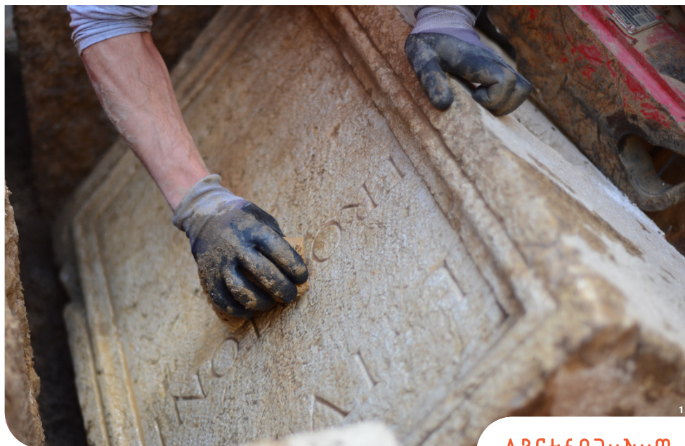
Fig.1 : Dégagement d'un bloc portant une inscription.