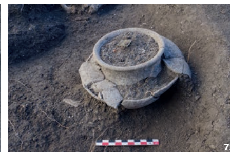
4. Au-dessus d'une fosse circulaire, les vestiges d'un foyer avec une plaque d'argile installée sur une couche de pierres - 5. Tombe double, avec deux squelettes en position foetale - 6. Inhumation associée à un récipient en céramique - 7. Détail du récipient déposé à côté du squelette.

» À l'issue de la fouille, l'aménagement urbain se poursuivra. Côté archéologie, les investigations se dérouleront en laboratoire durant deux ans. Un important travail d'étude sera réalisé par les archéologues et les spécialistes, notamment pour affiner la chronologie des occupations. Finalement, les résultats seront rassemblés dans un copieux rapport, remis à l'État avec l'ensemble de la documentation et des objets collectés sur le site.