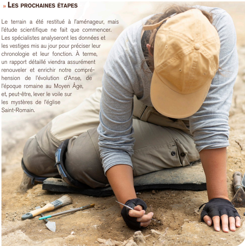
Fig.9 : Fouille minutieuse d'une sépulture.

Le terrain a été restitué à l'aménageur, mais l'étude scientifique ne fait que commencer. Les spécialistes analyseront les données et les vestiges mis au jour pour préciser leur chronologie et leur fonction. À terme, un rapport détaillé viendra assurément renouveler et enrichir notre compréhension de l'évolution d'Anse, de l'époque romaine au Moyen Âge, et, peut-être, lever le voile sur les mystères de l'église Saint-Romain.