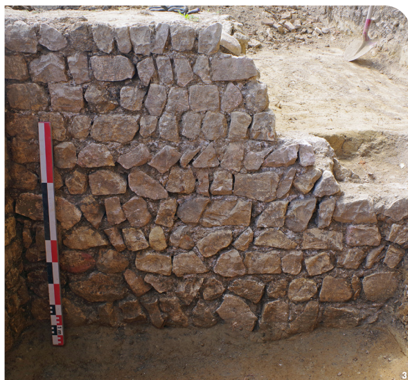
Fig. 2 : Plan général des vestiges. - Fig. 3 : La cave romaine et sa belle élévation. - Fig. 4 : Canalisation romaine en béton de tuileau.